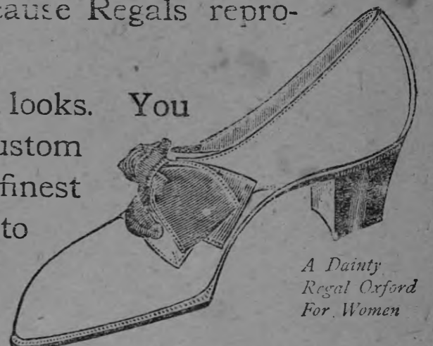
A Dainty Regal Oxford For Women